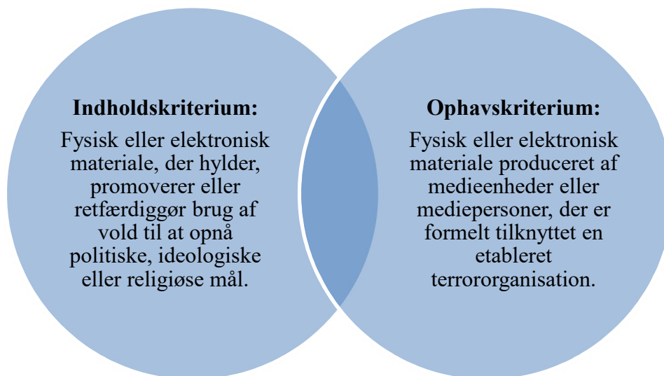
Tabel 8.1. Minimumskriterier i definitionen af terrorpropaganda.

Det første kriterium er indholds fokuseret og indbefatter, at fysisk eller digitalt materiale, der hylder, promoverer eller retfærdiggør vold til at opnå politiske, ideologiske eller religiøse mål, altid må betragtes som terrorpropaganda uanset materialets ophav . Dette kriterium vil konkret medføre, at f.eks. videoer med henrettelser udført i Islamisk Stats navn og plakater med glorificering af terrorangreb vil inkluderes i definitionen af terrorpropaganda, selvom producenten af materialet er en onlinebruger uden formel tilknytning til en terrororganisation. Kriteriet er væsentligt, fordi udbredelsen af lettilgængelige redigeringsværktøjer og brugerdrevne platforme har medført, at en stor del af det materiale, der er i omløb i dag, er produceret af sympatinetværk og løst organiserede onlinebrugere, der kun symbolsk, men ikke formelt, har en relation til de etablerede terrororganisationer. Nutidens propaganda produceres således af en bred samling af medieenheder og mediepersoner, der i meget varierende grad er tilknyttet kerneorganisationerne. På baggrund af trusselsbilledet og forskningen på området vurderer indsatsgruppen, at det alvorligste materiale, der udtrykkeligt glorificerer og opfordrer til terror , bør inkluderes i en definition af terrorpropaganda uanset materialets ophav .