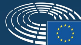
Graf 2.1.