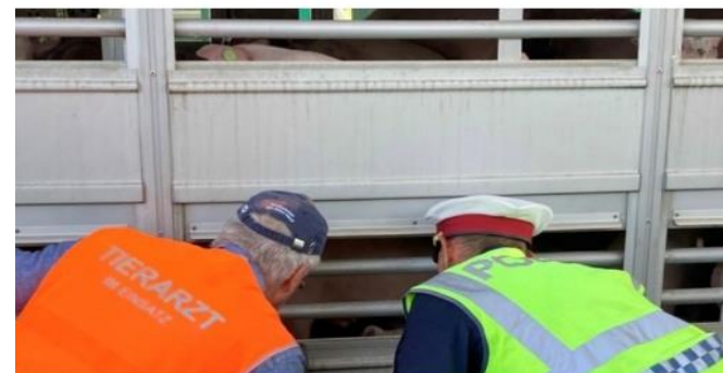
Tierarzt und Polizisten inspizierten den Transporter.

750 Ferkel in einem Tiertransporter, 29 Stunden lang unterwegs von Dänemark nach Serbien: ein trauriges Beispiel von vielen auf den europäischen Straßen. Das Fahrzeug wurde am Grenzübergang Spielfeld überprüft. Die Polizisten stellten rasch fest: Hier passt einiges nicht.