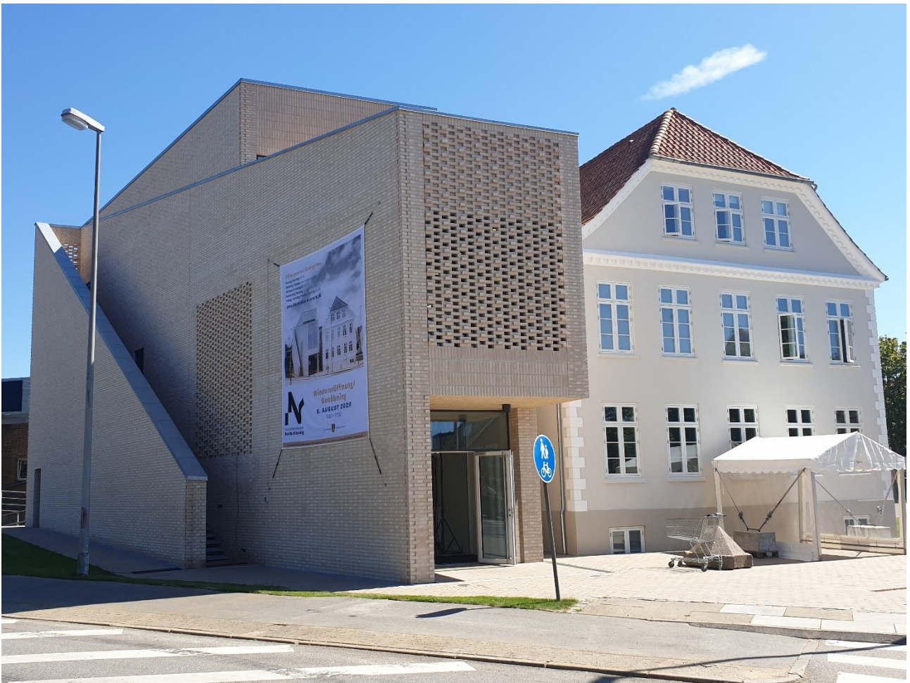
Museet udefra: tilbygning og den oprindelige bygning.