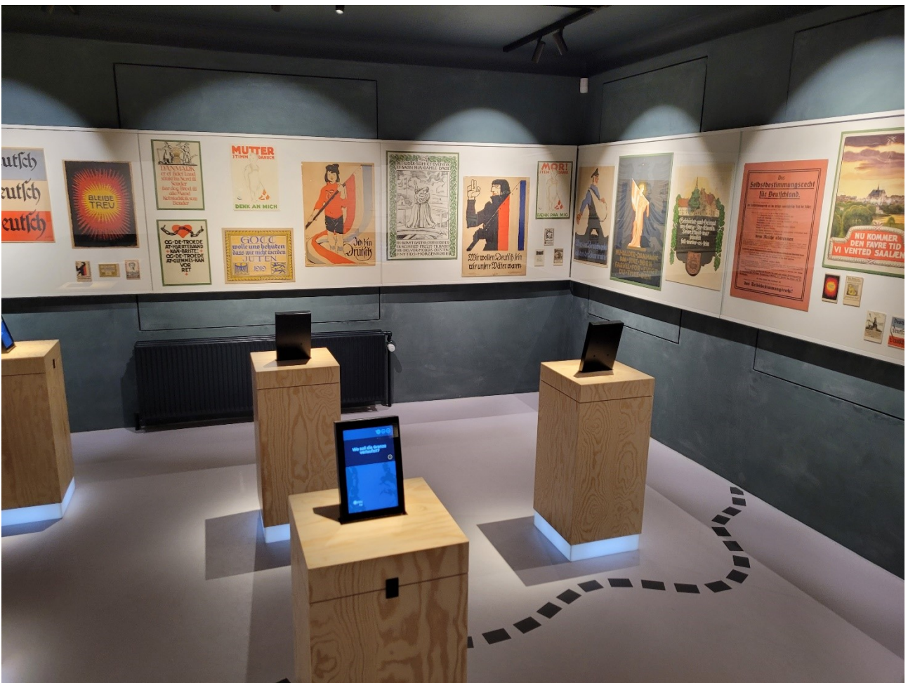
Fra den nye udstilling: Folkeafstemningen 1920.