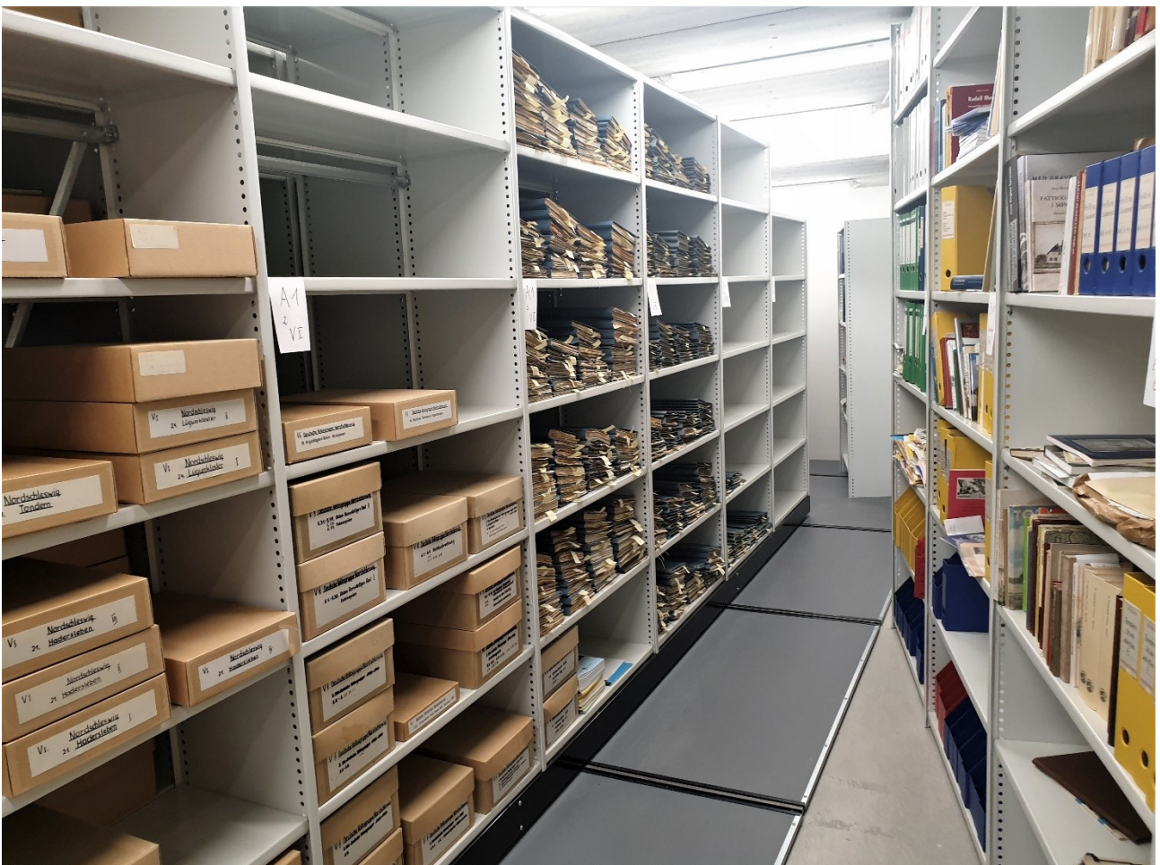
Archiv der deutschen Minderheit (i museumsbygningen)