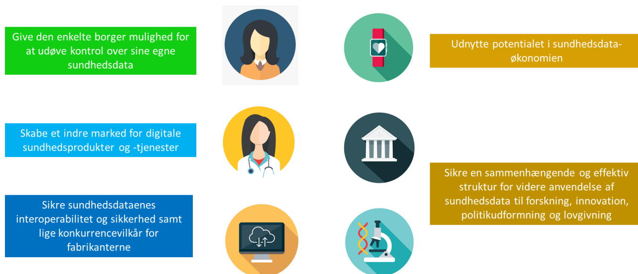
Figur 1 — De primære formål med det europæiske sundhedsdataområde

Folk deler gerne deres data, hvis der findes rammer, som de kan stole på 11 . EU-borgerne vil kunne få adgang til og dele deres data i realtid, samtidig med at de bevarer kontrollen over dem. Det europæiske sundhedsdataområde vil give mulighed for at opnå en mere effektiv, tilgængelig og modstandsdygtig sundhedssektor og bedre livskvalitet , samtidig med at det giver den enkelte borger kontrol over sine egne sundhedsdata og mulighed for at udnytte potentialet i dataøkonomien . Som sådan vil det europæiske sundhedsdataområde få en betydelig positiv indvirkning på de grundlæggende rettigheder med hensyn til beskyttelse af personoplysninger og den frie bevægelighed. Korrekt udformet med den europæiske åbne videnskabscloud (EOSC) og de respektive europæiske datainfrastrukturer inden for life science 12 vil det give forskere, innovatorer og politiske beslutningstagere mulighed for mere effektivt at anvende oplysningerne på en sikker måde og på en måde, der beskytter privatlivets fred.