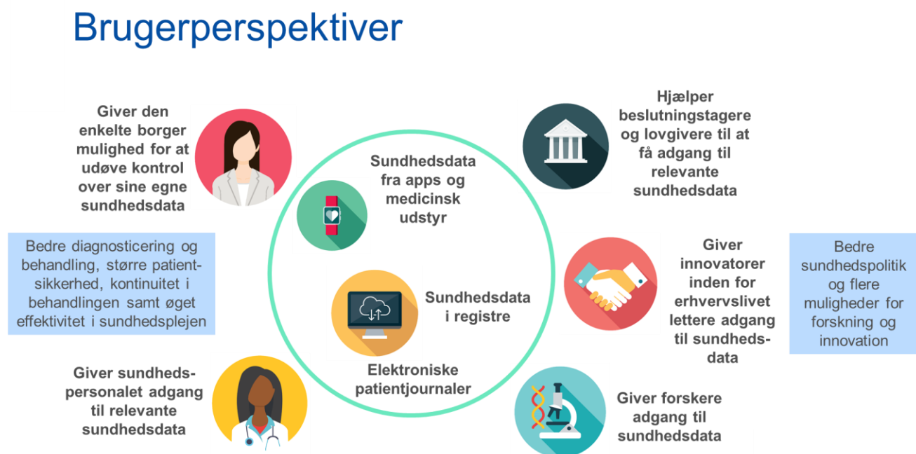
Figur 4. Fordele for brugere af det europæiske sundhedsdataområde

Det europæiske sundhedsdataområde vil være til gavn for den enkelte borger, sundhedspersonalet, sundhedstjenesteydere, forskere, lovgivere og politiske beslutningstagere.