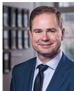
Nicolai Wammen Finansminister

Jeg vil gerne kvittere for det store engagement, der har omgivet arbejdet med denne handlingsplan. Tak til alle jer, der har givet bidrag og delt ud af jeres viden. Det samarbejde vi har haft, og fortsat vil have, er værdifuldt. For vi kan ikke løse den store opgave, som Verdensmålene repræsenterer, alene. Vi er nødt til at stå sammen.