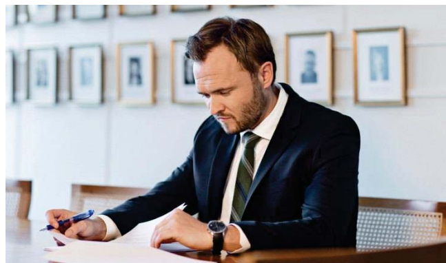
Dan Jørgensen Fødevareminister

Sammen skal vi gøre Danmark til Europas foretrukne destination for lyst- og fritidsfiskere.