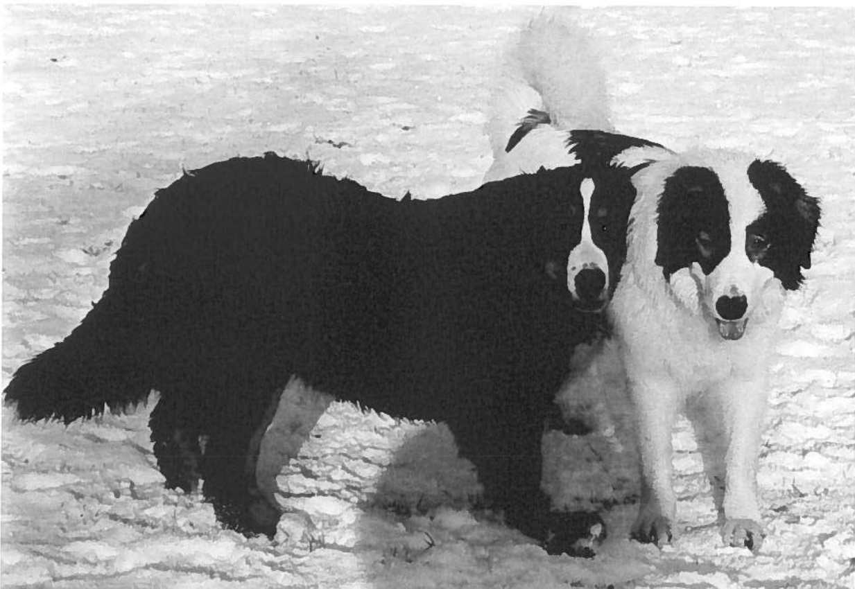
Berner Sennen & Tornjak