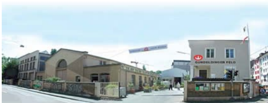
Gundeldinger Feld, Basel