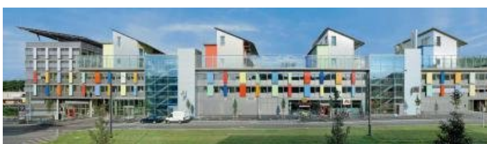
Sonnenschiff, Rolf Disch