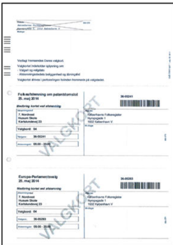
Figur 2 – Illustration af ny valgkortløsning

Nedenfor er gengivet en illustration af KMD's nye valgkortløsning (figur 2).